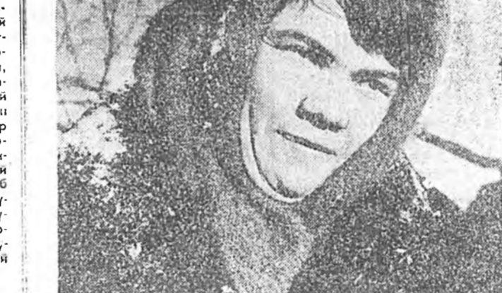
Малшадай мурьсөөндэ үгэн дэлмис

Яадна бүү эбсэгүүднэ бэлдэлгэ бага болгохын тулоо тэмэлдэ яадна бүү эбсэгүүднэ тараахагүй, дэлхэйн элдэз районуудта яадна эбсэгүүдэй зононууде байгуулаха хэмжээгүй шухала нури ээлэнэ. Зарим газар нотагуудын, хото горуудын яадна бүү эбсэгүүдэй зононууд болгохо сонсохого нимэл зорилготой юм. Эб найрамдал хуби анхрал мэдэржэ байнэ, энэний тула ямар абуулгонуудынээ бэлүүлжэ хараатай байнэ энэ бүтэмжтэй ойгонобди. Амгалан табан байшан ганса ганса хирисхээр баригдаа гэжээ. Шахаруу шанга байдлынэ хуларуула бага баганаар лэ бүрилдүүлгэдэ гэжээ. Яадна бүү эбсэгүүдэй зононуудынэ бэйгуудынэ дэмжээгэ муничиалтгээдүй, бусад эмхинүүдэй хүдэлөөнэй үргэн бэхжээжэ байнэнь харахадэ баясамаар лэ. Манай