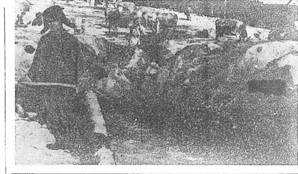
ЗУРАГУУД ДЭЭРЭ: Хаалишад олон, Тэднэр баһан гурья мяганай дабаанда нилээд дүүлжэ байна. Манай фермын

Халхусайн хүтэлбэригдэг хүнүүд хэлсэнэ. Халхусайн хүтэлбэригдэг хүнүүд хэлсэнэ. Халхусайн хүтэлбэригдэг хүнүүд хэлсэнэ.