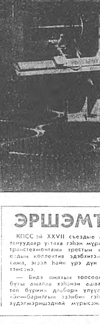
К. ЖАМБИЯНОВ. КПСС-эй XXVII съездые ажлал амжал-тануудар уртаха гүлэн мурсыонд «Водер 82» по-едайн коллектив эрбэтэйгээр хебадал-сама, эгээл һайн үр дүн тухайын тула тэмээнэ...