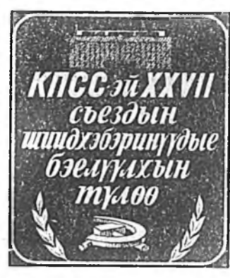
КПСС-эй XXVII съездын шийдхэбэринуудыг бэлтгэхийн туслаач

Газеттэйнай 1921 оной № 71 (17194) 1986 оной мартын 25, вторник Сэн 3 мүн.