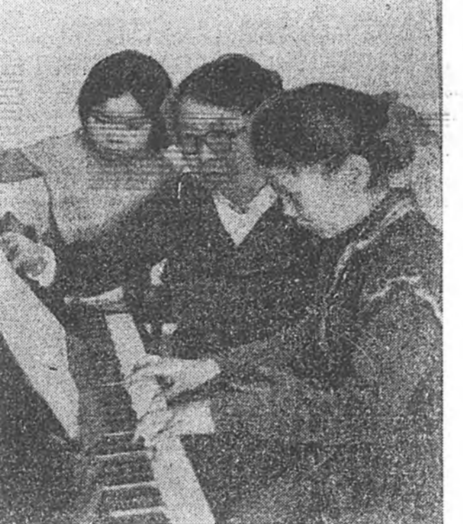
Түнхэнэй районот түб Хэрэн тосхондо хүүгэдэй хүгжэмэй тургуулин анха нээгдэхээр хойр хайса гаран жэл үнгэрсо.