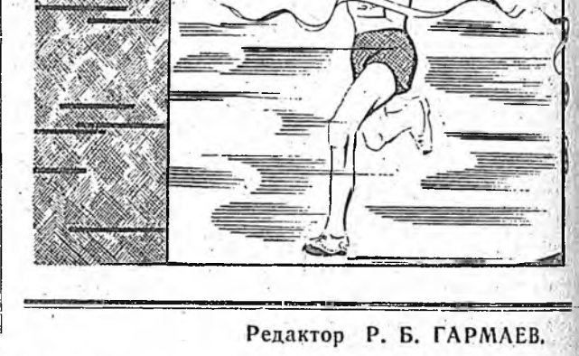
Редактор Р. Б. ГАРМАЕВ.