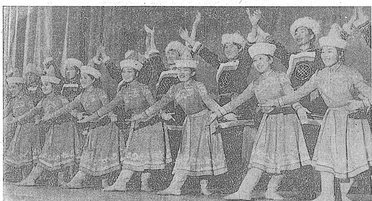
Буряадай багшанарай институтай дэргэдэй студентнэрэй «Байгалай долгинууд» гэжэ ансамбль шэнэ программа бэлдэжэ байна. Зураг дээрэ: хатаршадый бүлэг.

Юртын үлэжэриин эрлэ байдлаа худэлжэ шадаһаа хүнүүдэй худэлжэ туйга Совет гүрэн эрхэ эрхэ болкомонууды мүн лэ олгодо Инавалидуудай худэлжэ түрэн предпринимуд байгуулаһаа. Мунөө эрлэ байдла РСФСР-эй 1250 гаран икөө предприняти, цех болон үкөө худэлжэ. Тэндэ мөдигүүдэй үгэрлжын адалгаала дотор тухай эрхэ байдлаа 125 миллион хүн худэлжэ байна. Гэрээтэ байгаад ажал тэжабалда мөндө бин. Совет Федерацида 188 мянга шөдөр хүн гэрээтэ байгаад худэлжэ. КПСС-эй Программын шаһайруулаа дотор социальна хангалгы саашаада хүрээг гээд харалагдаһан. (АПН)