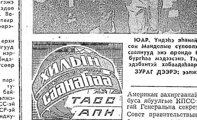
ЮАР. Үндэгшэ яһанай ниггаа гаргалгые буруушаһан, Нельсон Манделын сулолхэ тухай эрилтэ табиян митинг, жагсаалууд энэ орондоо үргэлжлөөр гэжэ Иоханнесбургта мэдээснэ. Тэдэниие киногоруулаха хэрэгтэ полици эрхбэйтэй хабаадаһаар.