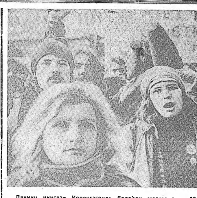
Данин нислэг Копенгагеда болоһон жагаалда 20 мянга гаран хүн хабардана, эб найрамдал хамгаала, буу элүүр үрдилдэн бэлдэлгине хорию тухай эрилтэ табиба. Хар-барай энэ хүсэтэ хүдэрлоонд элдэб ислэлтэй полициескэ партинуудтай тулоолгонод, эхээрнуудтай, залуушуулай болон профсоюзнуудтай эмхнүүд хабардаа, зураг дээрэ: жагсаалай үедэ.

Уушымнай алхамууд тээрүүлгэн газарта асаргадга, 12 жолоошоднай хотуугаар моринода хургалда абанага ГАИ-гай худалдарилашад багарида, бултадаа хэбэгдээ, ала түлөө бэлэй. Энэһинээ гадна 8 хүн хуули, ёһо гүри-м эбдэгшээһингээ түлөө ха-риуусалгада хабардуулагдаа юм.