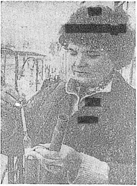
дэгбди. Тарха тарилгын, хуряалгын, үблэ тэжээл бэлдэхлэйн үедэ худөөгэй ажла...