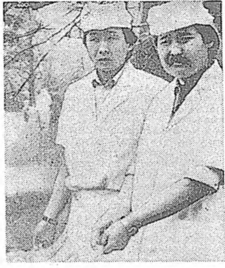
Сагай уларилтай тиймэ урин бэшье хаа, хара үлгөөнөө Комсомольско арал дээр...