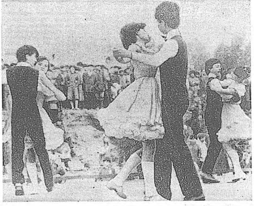
Сагай уларилтай тиймэ урин бэшье хаа, хара үлгөөнөө Комсомольско арал дээр...