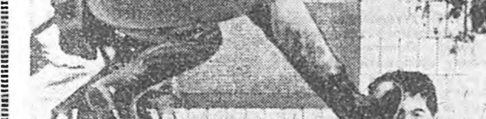
НИО-НОРК. Ядерна элш...