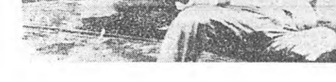
НИО-НОРК. Ядерна элш...