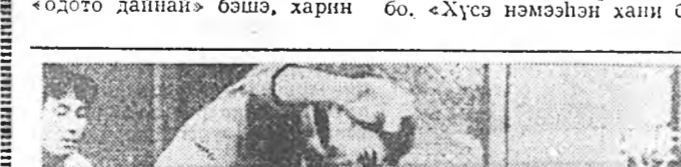
НИО-НОРК. Ядерна элш...