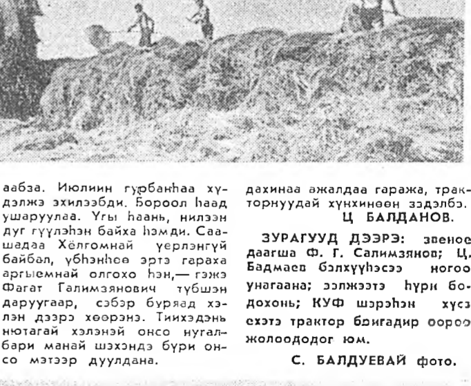
Набархан, түрэнхэй аад, до-тоонин бар хүсэтэһөн мэдэр-тээр сөб гэмэ бээтэй, талын наранда шаруулжа, һалхиндань шэрбүүлжэ хүрин хара боло-шоһон шарайтай хүн ехэл хи-дааба. Ю. И. Юлинин гурбанһаа хү-тэрлэжэ ажиллажа. Бороол һаад ушаруулаа. Үгү һавы, нилээн дүт гүүлэлэн байха һамди. Са-шаджа Хөлгомной үлгэрнэй байбол, үблэнһөө эртэ гэржаа арбимнай олгохо һэн, — гэжэ Фагат Галимзянович түбшэн даруугаар, сээр буряад хэл-лэн дээрэ хөөрөн. Тихэдэнь нотагай хэлэнэй онсо нугал-бары манай шхэндэ бури он-со мэтээр дуулана.