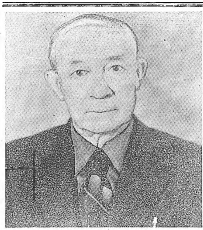
Байгаали хамгалгын эдэбхитэд Олондо хүндэтгэй