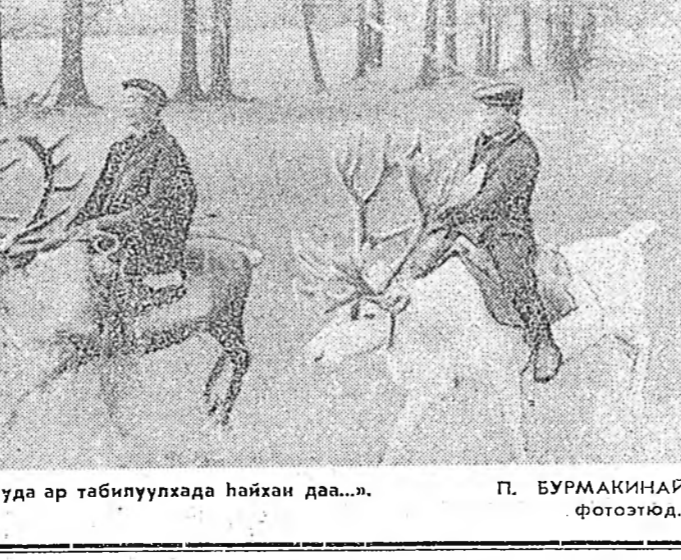
«Мэдээгээ аад, юрз бусын Фивил, Зиданай, 1915...»

«ПРАВДА БУРЯТИИ» Нэгэдэх хууданда, «КПСС-эй ЦК-гай Политбюро», «Парти арадтава зүбшэн» — ТАСС-ай материалууд, Фермэнүүдые үблэдэ балдэлг.