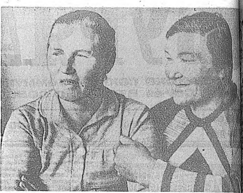
Түнкэйн районы Ажал Улаан Тугай ордоно «Сибирь» колхозой наалишда гүрэнэ нү худалдаа хэргийгээ даабри байгаа оной сентябрийн 7-до дүүргэв.

Харин мүнөө пертком партина хүдэлмэрийн үндэснөөр шэнэлэн хубилгаха зорилго табиба, коммунист бүхнине сьездын табибан шийдвэрийн үндсэн үндэсний үндэсний хароусалгатай, хүннэн бэш зорилгонуудыг табиба, Үйлдвэрийн бүх үнэстөгүүд дээр эмхитэйгээр, журамтайгаар, бүх хүсэ шадлаа үргэж хүдэлж, партианы организацын ажил абуулгын онол оргоноудын шэнэлэн хубилгаха орлнтанууд табибада.