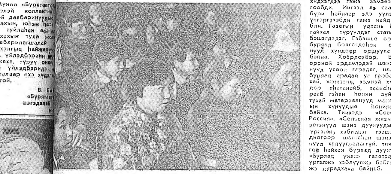
В. БА... «Буряад унэн» газетин редактор...

ТИМЭНЭЭ ЭЭЛ Хүнэй нэгжлэггүй бэлгэ олохоор Сагаа ниндэл дундань шүүрэнхэн үеын хүхэд, Ханхинаагүй дуунайнаа дэлхэйдэ ошохоор Сөдхэлдэнгэ мунхэ галыг дууданан Түмэн хүтлэгүүдэй дэлхэн мэтэ, Түмэр релснүүдэ хүсөөлө шудхан дайнаа бэшэ гү? Эпэл байдалайн нойргүй харуулда харуулда Аршалжа хилдээ Николой Петровууд унаа бэшэ гү?