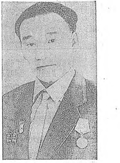
Хэ тухай бодомжологдоно... Хэ тухай бодомжологдоно...