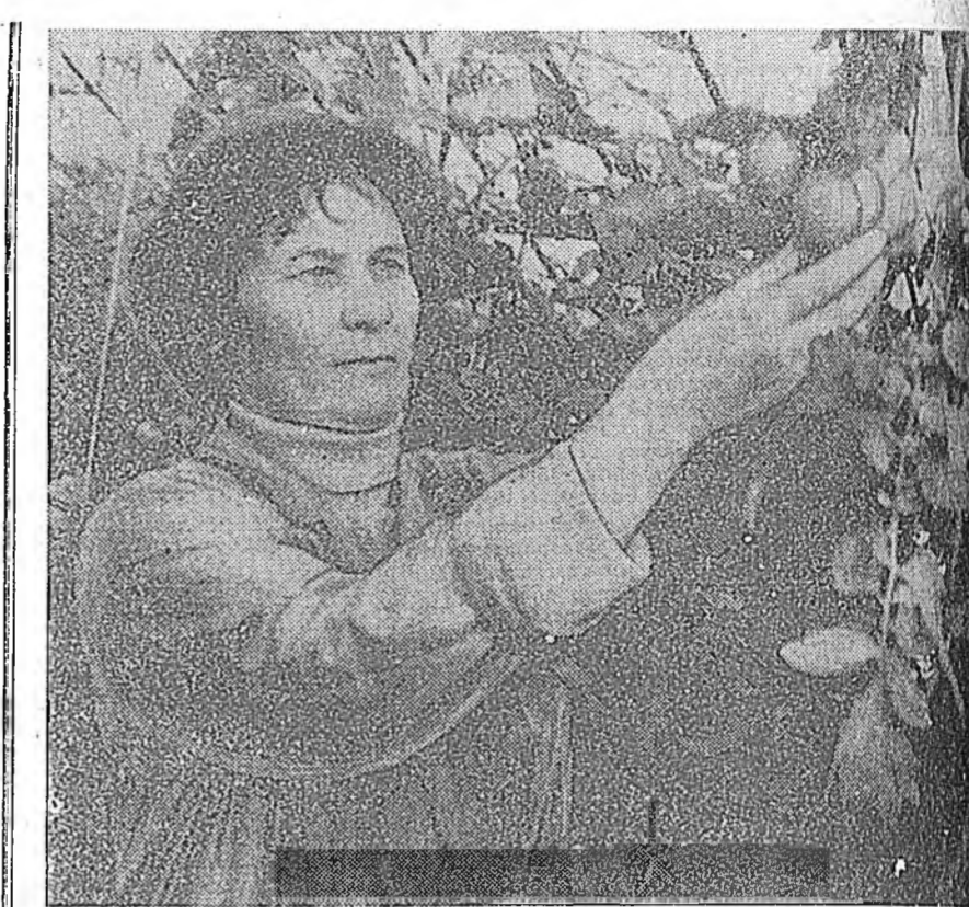
Газга үблэй хүтэлбэрлэхэ янгилжа байха үедэ набтаршгэн энэ байрын досоо ан-бун дулаан.

Мөнхэй хүтэлбэрлэхэ дутагданууд бии. Тэдэниие пленум дээр үгэ хэлгээдэ сүм заагаа.