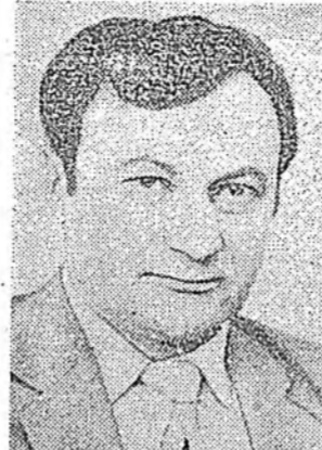
Балшар наһан тухай шүлэг