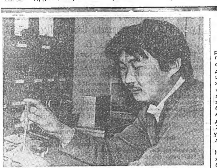
Мүрысөөнэй түрүү зэргэдэ