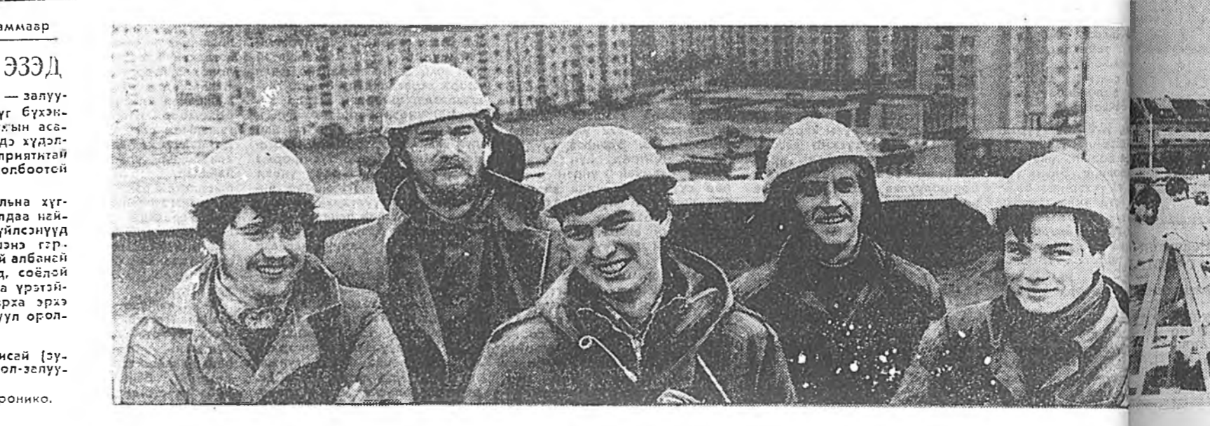
Социална хүгжэлтын программээр ГОРОДОЙ ЗАЛУУ ЭЭДЭ