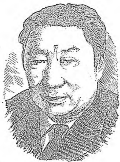
Ц. Г. Галсановай түрэнхөөр 70 жэлэй ой гүйсэбэ

СССР-эй Зэбсэгт Хүснүүд ямаршэ зорилгонуудыг дүүргэхэ хаба шадагтэй, Тэрэнэй тулада тэд хэрэгтэй бүхэ хэрэгсэлнүүдээр дүүрэн хангагданхай; мүнөө үеын зэбсэгүүд, техникэ, эрхим хайнаар хургагдан сэргэжэ, түрэл эрдмтэй хивэргүй үнэн сэхэ командирнууд болон политикческэ кадрнууд бии.