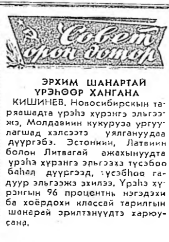
Эрхим Шанартай үрэнһөөр Ханганга...