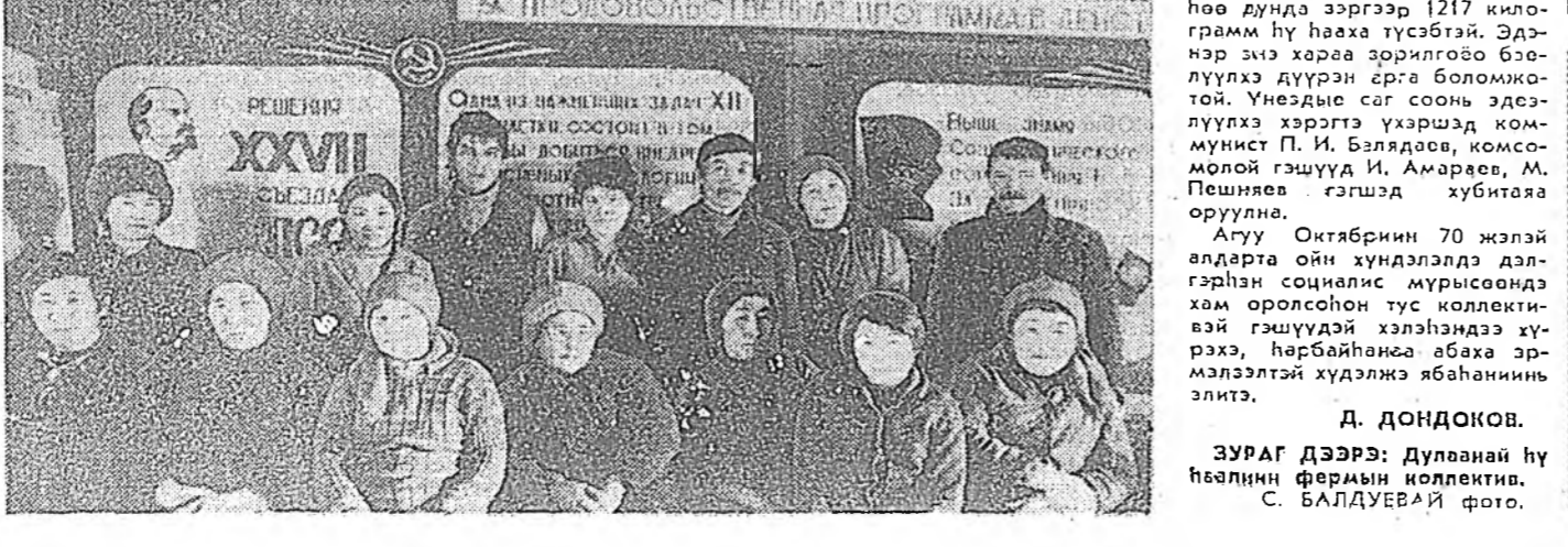
Аугуу Октябрьн 70 жэлэй алдарт ой хүндэлдэлд дэлгэрэн...