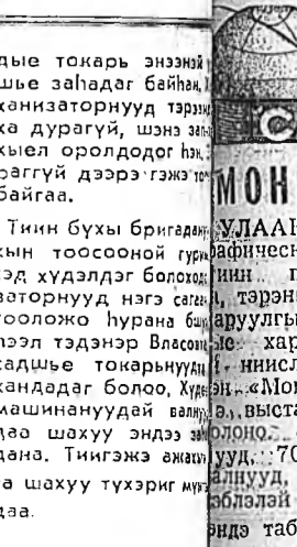
Эрхим Шанартай үрэнһөөр Ханганга...