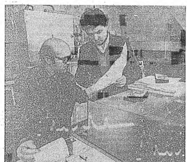
СССР-эй Наукуудай академин Сибириин отделениин Бүрэдэй филиалы Геологичин институт. Эндэ хүдэлдэг коллекци Байгал далай шадархай болон Забайкалийн газарай хурьһэй, тэрэйдэй хүмжээтэй болон хувилтануудыа шэнжэ шарыра, бүриэлхы шэнжлэдэг. Тэднэй эхлэн шинжлэгшүүдэй үйлдэрин дээрэ ашагта малтануудыа бэдэрэх ба ашаглаха талаар хартанууд зохиогдоно.

Болоо һэн. Тихээдэ Велингтон нотагийнгаа техникческэ мэргэжлэй үчилхидэй дүүргэгээтэ эрээд, түрэл совхозойнгоо үбэр хураалгада хабаалсаа бололэй. Тихээдэ тогтуунигууд үйлдэри дээрээ гэгшүүнтэй шайртай үлэгэртөө олоо һэн хувиһаа, одоол сэлэмжэ, наран игаа ба гэгшүүнтэй, гэгшэ асарлагда, үдэсэлээн тээшэ бороо бүри һураһаар асарлаха. Тихээдэ һаану, тус элсөөнхид шадан эргээртэ үбэрэе абса юм. Ингэһээд Милонов эхэ зун өөрингөө ажаллай намтар эхилээ. Хууһынхаа һаа, мөөртэй трактор дамба абса. Бригадирэй үгэлээн дабарай залуу хүрээд эхэ нарын һаагаа, гуримтайгаар дүүргэдэг һэн. Энэ талаараа тэрэ бусад үетэн нүхэдэйнгоо дундаһаа илгөрдөг байгаа.