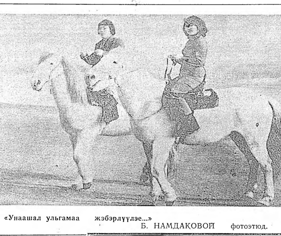
«Унашал ульгамаа жөбөрлүүлэе...» В. НАМДАКОВОЙ фототюд.