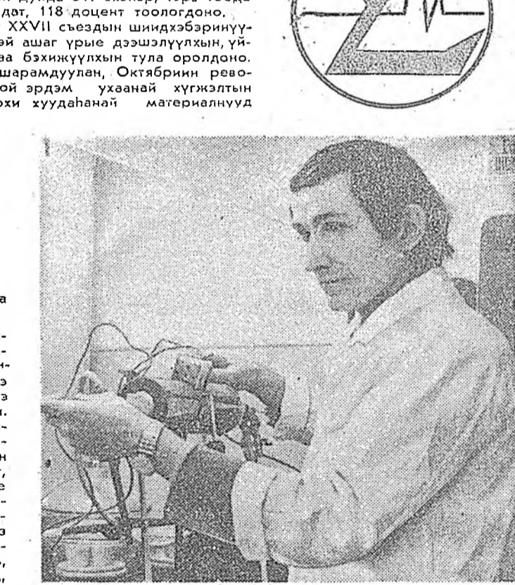
Тиммэзэ манай шэглэлээр бүхү дэлхэй дээрэ гарадаг журналнууды уншаха ушартай болоноби.