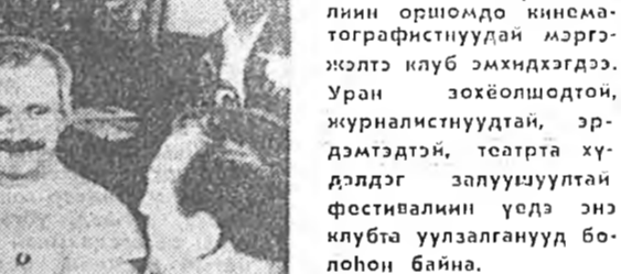
УРАГ ДЭЭРЭ: италян мэдээсэ киноактер Марчелло Мастрозини, совет кинорежиссер Никита Михалков, совет актер А. Романши клубта болоһон уулзалгын үедэ.