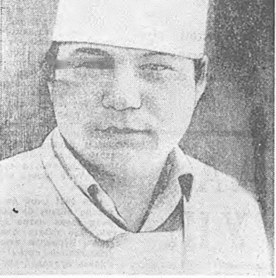
Хурбын лехоз болон Хурбын леспромхоздо хүнүүдэй элүүр энхэ хамгаала хүдлэмж, урид хараалдагхан тусгай ёһоор, шата шатаараа бэелүүлэгдэнэ.