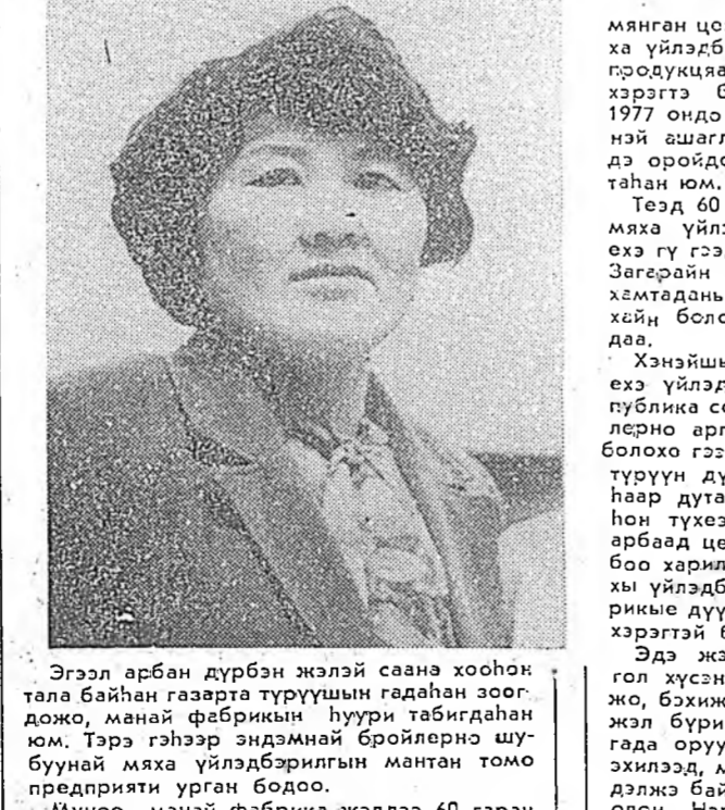
Эгэл арбан дүрбэн жэлэй саана хоохон тала байһан газарта түрүүшын гадаһан зөөдо, манай фабрикийн нуури табигдана юм. Тэрэ гэнээр эндэманай бройлерно шубуунай маха үйлдбэрлгын мантан томо предпрятэй урган бодоо.

Мүнөө манай фабрика жэлдээ 60 гаран мянган центнер һайн шанартай тажагай маха үйлдбэрлжэ, эдэ хоолой энэ шухала продукцар хүн зоной хэрэглэмхэ хангаха хэрэгтэ бага бэшэ хубита оруулна. Херин 1977 онд предпрятин түрүүшын ээлжээр ашгалагдаа оруулагдаад байхада, эндэ оройдоол 6 мянган центнер махан абтаһан юм.