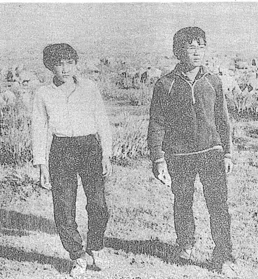
Атхата гэжэ үзэхэлэн байн...