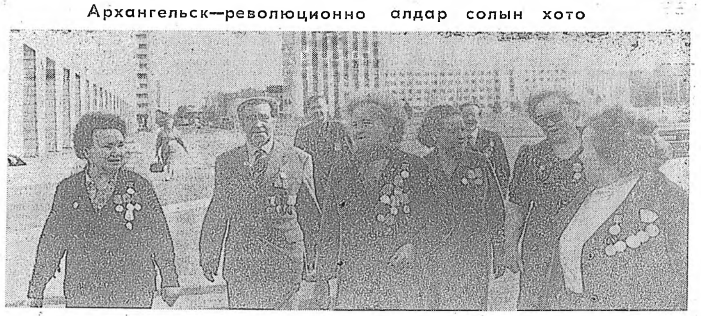
Тасс-Апн конференци нэгддэбэ. Коста-рикын коммунистуудай съезд. Архангельск-революционно алдар солын хото.

Түүнхи худуогэй библиотекэ болон дайны ветеранууды. Түүнхи худуогэй библиотекэ болон дайны ветеранууды.