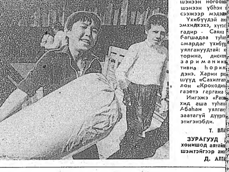
УРАГУУД... Эсгээ орооно хамгаалгын...