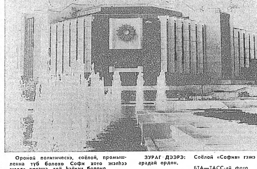
Оройн политическ, соёлой, промш-ленна түб болохо Софи хото жэлнээ жэлдэ уржага, гоё найхан болоно.