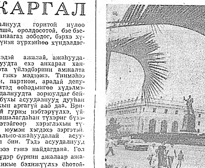
ЗУРАГ ДЭЭРЭ: Сухуми, Абхазин АССР-эй правительствын байшан.

19 зүйл ородог гэһшэ. Араду гэжэ томо гэгшын һалбар гэмээр модо нэрлэдэг. Бүгдэһэн халуун үдэр энэ модоний һуудэтэ ходоодо аргатай нэрюун байдаг юм. Тэрэни шиги «Араду» хүнэй бөөһе һэрюусууна, һэрэгт һайн болгено бшуу.