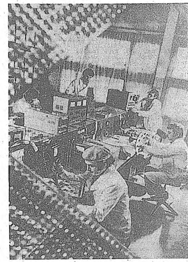
ЗУРАГ ДЭЭРЭ: «Оргтехника» гэжэ үйлдэбэрин Сухумска нэгдэлэй директорой орлогшо.

Хүдэлмэришдэй ажалай түлөөһэ тодорхойлох, тэдэни гол салын худалса цехэсэй хүдэлмэрин дүнгүүдэй холбохо, инженерно-техникэсэй хүдэлмэри ба алба хаагшад тухалай салингой 30 процентын хэмжээний хүртээр салын хүлэндэһэн нэмэлтэ түлбэри тогтоохо, хүдэлмэрин нормоһоо гадуур сагай түлөө түлээ, кадрнуудай талгай зохиолуудан хүдэлмэришэдэ баха, амалһаа гэрхэ эрхэ цехүүдэй хүтэлбэрлэгшэдэ үгтэнэй.