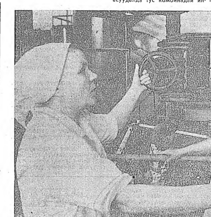
ХАМТЫН ПОДРЯДАЙ АШААР

ЗУРАГ ДЭЭРЭ: П. А. Гнеушева, С. БАЛДУЕВАЙ фото.