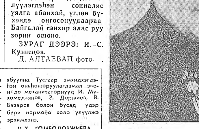
Суглаан дээрэ эрхэм хэлэгэн нэлэй үр...