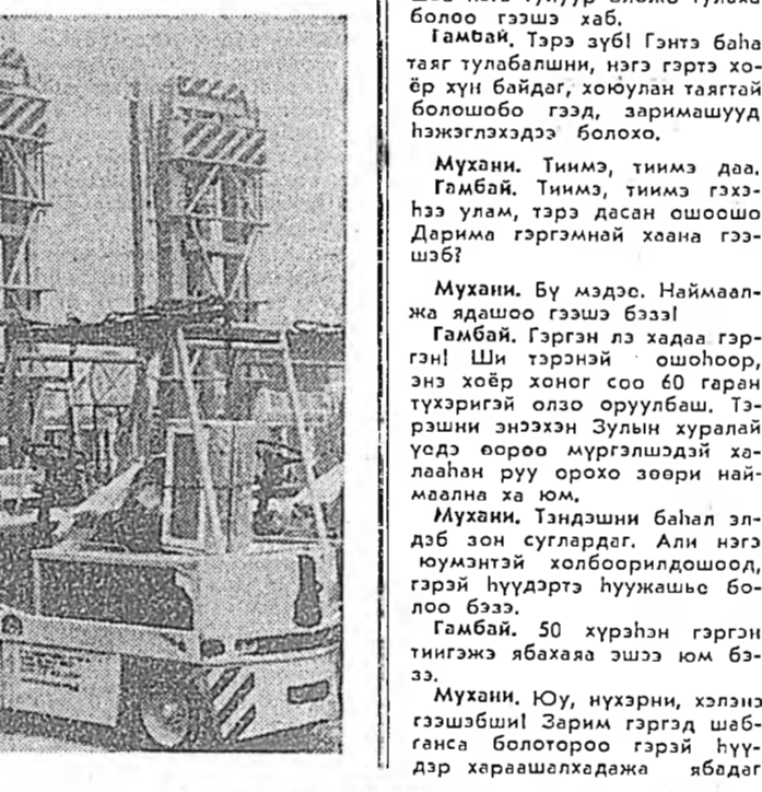
НРБ. София хотын машина бүтээгэйн «Средоце» заводой продукция болохо ашаа үргэн ашадат түхээрлэнүүдэй ээлжээтэ парти Советскэ Союздэ элбэгдээдэ бэлдэгдэжэ байла.

ПРАГА. Прага, Гиборникэй мүйзэн адрес Чехословакиянь зондошье, аймдагташе мэдээжэ юм. Эндэ 1912 ондо В. И. Ленинэй хүтэлбэри доор РСДРП-гэй 6-дахы (Прагадахи) конференци үнгэрэн түүхэтэй Жэл хаяхад соо үргэлжлэн хэрэгсэл шэнэжүүлгэн хүдэлмэрин хүлээлэр КИЧ-гэй ЦК-ай секретариатай шидэжэбэрэ муузын сар үргэлжлэн шэнэ экспозици нээгдэ.