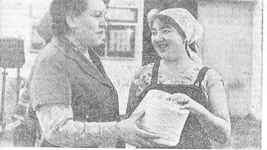
Арадай хиналтын бүлэгэй гэгшүүн байхан тула шалгалтанууд ба рсиднигүүдэд ходоодо эрбэлхитэйгээр хабдаадаг.