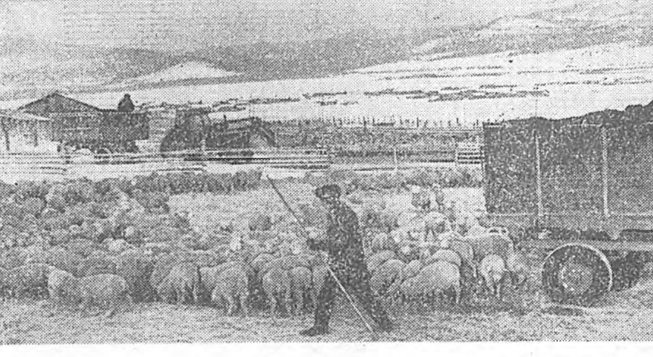
Энэ жэлдэ манай совхозой эхэ хонидот отаранууд үлгэртэ фермнүүд болохоор дэбжүүлэгдэнэ. Тиммэһэ хонидотной урда эхэ харуулагдай зорилгонууд табигдана. Һүүлэй үедэ зоотехническэ эхин тоо бүридхэл гуримшуулагдан һайжаруулагдаа. Үлгэртэһэ намартаа ототой болоһон эхэ хонидоо Хойто-Кавказэй үлгэртэ хуһануудай асаргадан үрбөөр үржүүлһэн байнабади.

Миний хүтэлбэрилдэг бригадэ хүнүүд эбтэй эсэйтэй үлгэ хүүдэлэ, Жэһээлхэдэ, Цыденбал Цыренов совхозой паркомой гэшүүн, нүүгэ хоёр хонидотной ажахын түрүү механикаторнуудай нэгэн юм. 6000 түлгэ нэгэ газарта байлаа, бэлшээгүй харуулаха гэжэ тиммэшые бэлэн бэшэ байна. Бид мүнөө хонин бүхэндэ үдэр соо 4 килограмм силос, 100 грамм обёос, 2 килограмм голоомо, 5 литр талха таранай бурдууг шанаа эдүүлэнхэй. Хонид сүдэһэ соо тус бүрээ шэгнүүрээ 200 Эдэ үдэрнүүдтэ тэжээлэй цехтэ сүүдэхэ соо 48 тонно бурдууг шанаалана, бэлдэгдэнэ. Энэ цех үдэр, һунигүй хүдэлгээгдэнэ. Эндэ гурбан дүй дүршлээтэй операторнууд КПСС-эй гэшүүд Дмитрий Будапанов, Цырендоржо Содномов, Дамба Аюуржанав гэхэд гурбан халаанда хүдэлнэ. Тэдэр хонидоо шанартай тэжээлээр танилдуулангуй хангана. ЗУРАГ ДЭЭРЭ: 1. Нэгэ газарта эмхидхэгдэн томо комплекс; 2. Бригадир, КПСС-эй гэшүүн В. Э. Цырендоржиев; 3. С. БАЛУЕВАЙ фототекст.