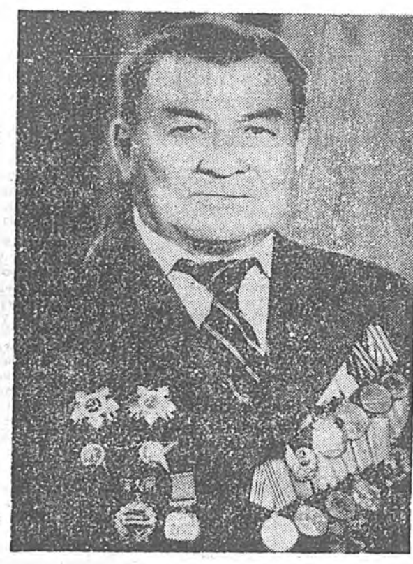
бшэ хүртөө. Энээн тухай хөөрхэн баясхалангай бшээгүүдэ тэрэ гамтайгаар хадаглана байдаг.

Зугадагша япон сэргээдэе хүсээе нэгдүүлхэ, хамгаалагша эхитэйгээр хээ арга олгохой хэрэгтэй байгаа. Довтолжо ябаһан совет сэргээдэе түрүү сэргээдэ тэгнууһад дабадаг хэн. Хинган галһанай хүлүүэр одоошье үһанда хүрбэ, мүн эгээл эдэ үдэрнүүдэ хура бороон ахаржа эхилбэ. Харгинуудай шабар шабага болобошье, Совет Армиин эрлэхэ баатарнууд урагша дабаһаар хэн. Цодунска тохой болон Цодунска хахад аралда хүржэ Дальян (Дальний), Лийшунь (Порт-Артур) хотонууды сүүлэбэ. «Хинганский» гэһэн хүндэ нэрэ сэргээдэ хүртэн алдар суута частунда тодо Николай Петровой алба хэдэ гвардейск дивизи нэрлэгдэе бэлэй. Эхэ ороной үндэр шагналнууд олон сэргээдэ хүртөө. Н. З. Петров үбсүүндэ Улаан Одоной хоёрдоо орден ялһан юм. Дайшалхы габьягайнаа түлөө Николай Захарович командованиеин бээр баясхаланда нэгтэе