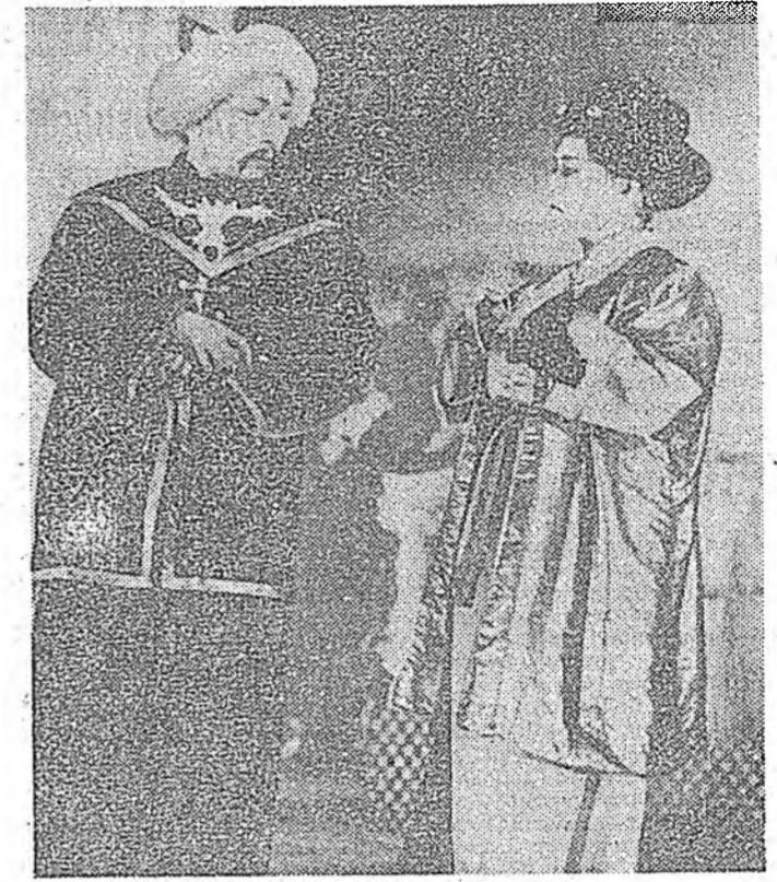
Гадна хоргодогчон унда Бүү-бэй бэлэ хандаа уулган үзэгдэл багал тон өөрсэ язаар найруулагдаа.