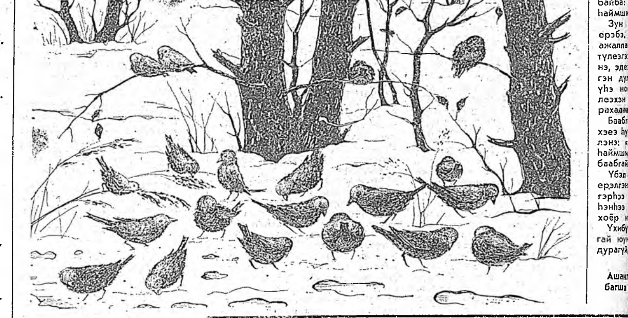
Игабарин үдэр. Л. ДОРЖИЕВАЙ зураг.

Жэн торгон захгүй, Жэнэ һуһан нүхгүй, (тэнгэри, мүшэн), Дохолон шаарай добуу тойроо амгатабыһе гэһэнэ, Шн хонхойой бү хонхойой Ноур ноураа бү харалса. (эмээлэй хоёр бүүргэ), Үхэг доро найман улаан шагай, (нохойн хүхэн), Өөб түхэрэхэн, оорхон бумбыхын, (хонхойн һүүл), Үлхөөгүй шүрээ, Эбхээгүй торгон. (мүшэн, тэнгэри), Хамаг юмэнһээ багахан аад, халуун далай соо тамарадг (шанага), Гэрэй хойно гэзэн агул, (гурлоотэй үнэн), Улаан бургаһан уруугаа ургаа, (үнэһэй һүүл), Тэнсүүриэ алданан тэнгэ баатар (ногтуу хүн), Гунжан үнэһэй хэблэһэн газарта Гурбан жэлдэ ноогоон ургабагүй, (түүдэгтэй һуури).