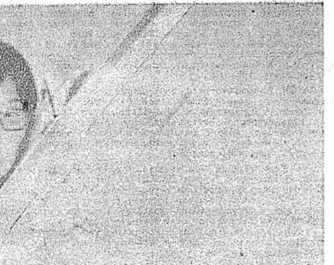
Ашур үрэтэ ажалай, энхэ байдалтай түлөө