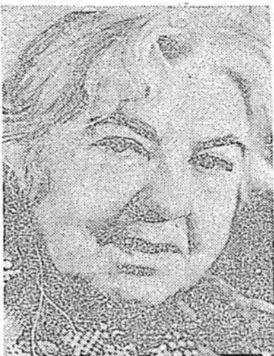
Мариэтта Шагиняна 15 наһатайда, XX зуун жэлэй эхэндэ литературада ороо һэн. 94-эйдоо тэрэ хуушынгай хэл бэшэлэн байгаа. Тэрэ нэй ажабайда (1888—1982 онууд) бүхэ юуман эрэ бундан байһан юм—ундэр наһатай болоторо зохиохи ажал абуулгаа үргэлжлүүлээ, элдэб юуман һонирхолтой байгаа, оюун хурса бэлгитэй һэн. Бүхэ наһан соогоо тэрэ айкалар эхэ юумэ хээ.