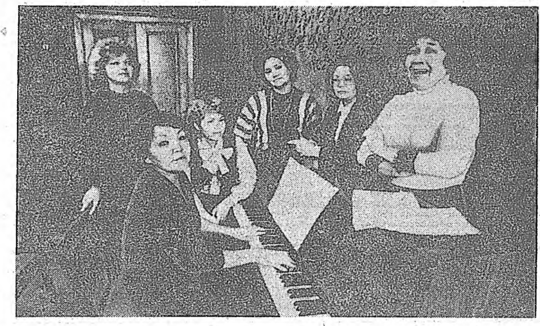
ЗУРАГ ДЭЭРЭ: Буряадай гүрэнэй филармониин хүжэмтэ лекторин артистнууд, Д. АЛТАЕВЫЙ фото.