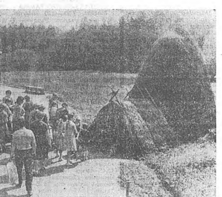
ЛЕНИНГРАД. В. И. Ленинэй дурскалхай Рязини нуурай дүргэдэ «Шалаш» музейн байгуулагдаар 60 жэл болоо.

«БҮРЯД УНЭН»... «ДАХИНАА АБТАГДАХА ЁНОГУЙ»... «ЭНГ ГЕТИК» ҮҮДЭЭЭ СЭЛИБЭ