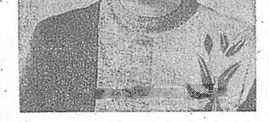
на. Ажалайн мүнөөдэрэй дүнүүдэе хаража үзэхэдэ, энэдри һаалишад энэ зорилгоо гүйсэд бэлүүлэхэ дүүрэн аргатай.

Зунай бэлшээрин август һара гэржа, илангаяа сагаан дээр элбэг эхээр үйлдбэрилгэхэ хаһа тулг үргэжэлһөөр. Карл Марксын нэрэмжэтэ колхозой бүхи һаалишад жэлһээ жэлдэ хуу абалгаа дээшлүүлжэ байхай.