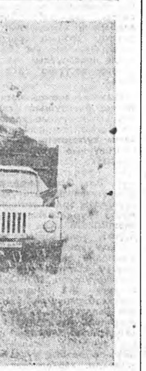
Дагбаев болон бусад магтаал-байхалдан хүдэлнэ.

Тус отрядтайда ажамн соо-гоо тэжээл бэлдэхгээдэй дунда дэлгэрһэн социализм мурь-сөөндэ нэгэтэ бэш шалгар-жа, үнгэрһэн августта, мүн сентябрь соомше хэдэн удаа шагнагдаа.