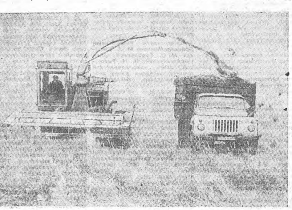
таама, үбһэн болгохо аргагүй байхалдан, нүхэндэ хээк сенаж болгообди. Тэрэнэйнай түлээ районий «Вперед» газеттэ машинэ шүүмжлэһэн статьяше