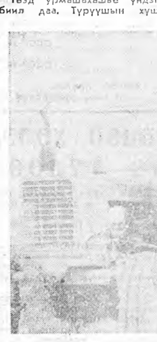
Тээд урмашахашы үндэһэн биил даа. Түрүүшын хүшэр