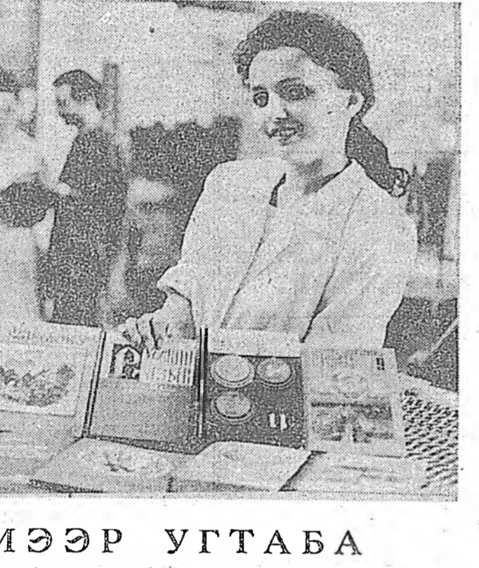
Эрхэмээр угтаба...