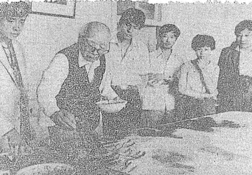
ХИТАДАЙ заналта зургаг гайхамшгта уран бэлтгэгч Л. Хайсу энэ зургаг хуралдаанад хуралдаанад оролцож байна.