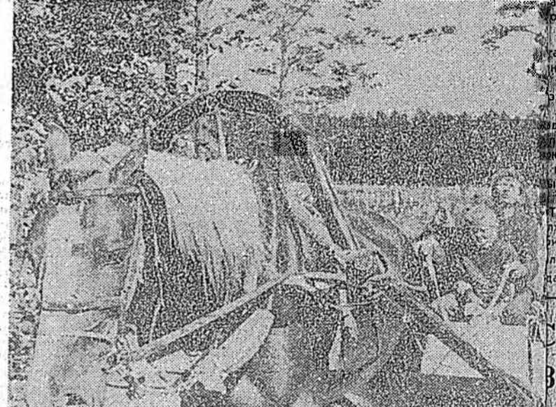
Намарай наруули дулахан үдэр дээдэ Онгостойн наһан т...