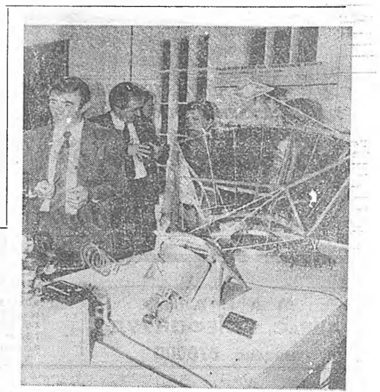
ЗУРАГ ДЭЭРЭ: эрдэмтэд түхээрһингээ дэргэдэ.

рэн хэмжээний суглуулбалтай гүйдэхэ тоологдог. Эхэ-бэшгүүд, нартанууд, тэдэнгээлүүд, экспедици гэгээтэй зурагууд энэ таһондаа. Лангдорһын нэрэ Бразилинда үргөнөөр мэдээжэ болонхой. Тэрэ манай оройһоо хоорондох харилсаана үндөө һуруине табигша гэжэ тоологдохо ёһоороол тоологдог. Бразилин үедаһын хэрэгүүдэй министр Роберту Коста ди