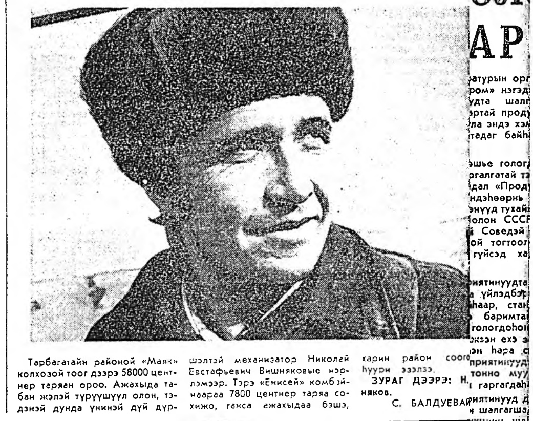
Тарбагатай районий «Маяк» колхозной тоог дээр 58000 центнер төрөөн орон. Ажахыда тэбан жэлэй түрүүшүүл олон, тэднэй дунда үнний дүй дүр...