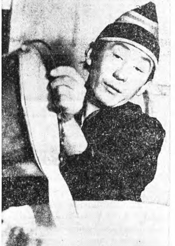
Оронгын совхозой һу һаалин хоёр фермн коллектив хүдэлжэ жэлэй даабарин өһоор 13400 центнер һу һааха үнэ.

Манай совхозой һу һаалин Фермэнуудай, малай гүүр- нүүдэй һаалишад, үхэршд, малшад түрэл Котмунис партияга Центральна Коми- тетэй бэшгэгэй танисгад бай- гадаа, энэ жэлэй малай үб- элжэһэн үшөө эмитэй һаа- нар үнэгээргэһэн тула үбэлэй һарнуудай түршад эхэ зар- ронуугатайгаа хүдэлжэ, үр- даа тебиһан зорилгонууде эрид шууд бэлүүлхин түлөө тэмсэн ажиллаһа. Бидэртэй хөрөөлһөн энэ зорилгоо бэ- лүүлэх өргө боломжо гүйсэд бии гэжэ мэдэрхэ ёһотойбди.