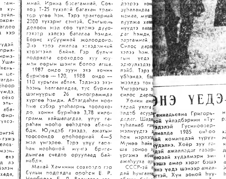
Энэ үедэ-шэ... Хонин ажал-гол хамгаа... Ондоо арга...