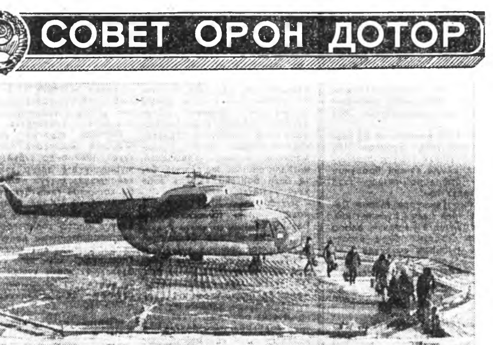
«Секанлииска» далайн үрэмдэглэгч үрэлэгийн коллектив үүсхэлээр... ЗУРАГ ДЭЭРЭ: үрэмдэглэгч талайда...