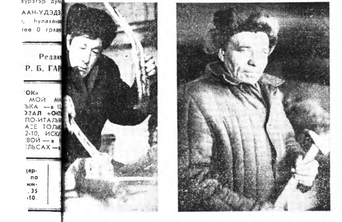
Түрөөр үргэһэн хуряадажа бэлдэл үргэһөөр ябуулжа

абан талмайной 2900 гектар байха юм. Тракторнууд, хуваа ажалын техникэ үсөөлдэгдэ. Хамта дээрэ 10 хүн худэлхэмнэй.