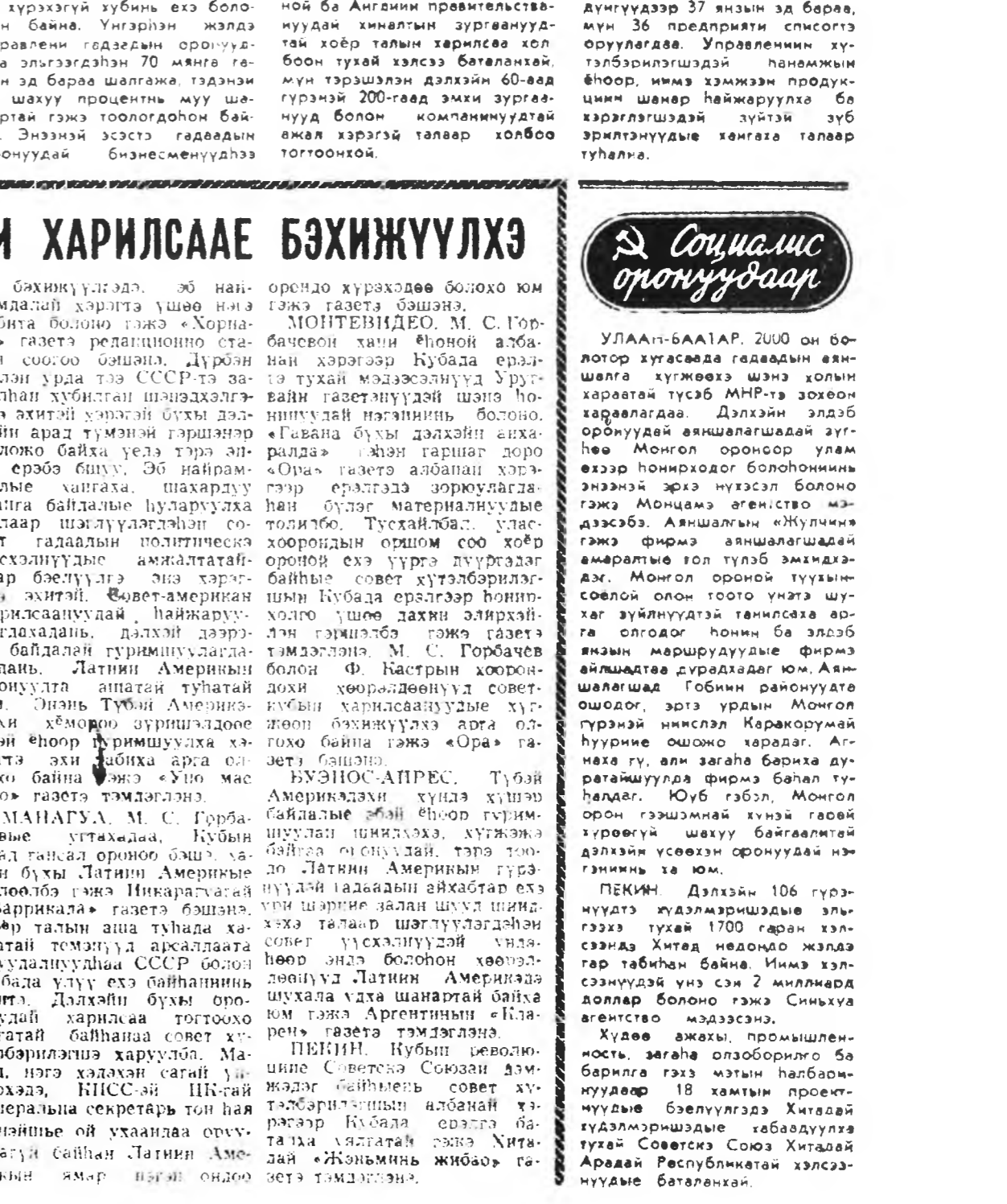
УЛААН-БААТАР. 2000 ОН БОЛТОР ХУГААДАА ГЕДААДИН АЖИЛЛАГА