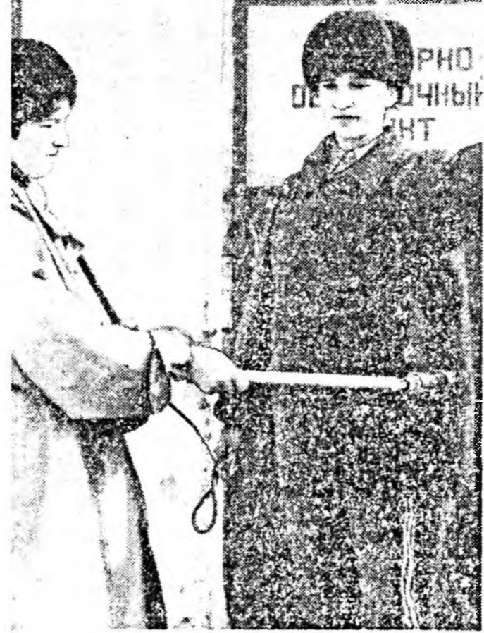
Хэрэгтэй байгаа хэрэгтэй...