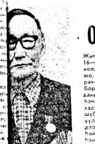
Мал 16-18 колокмо, рагай боридань хэбэ...