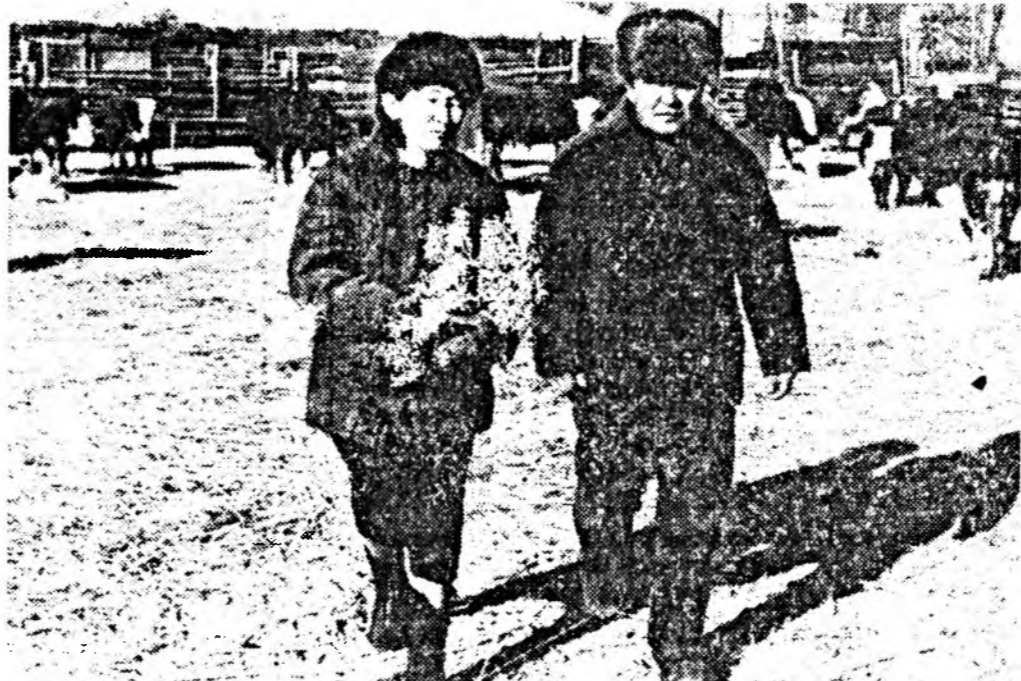
Цыден Цыленович Батомункуев Лысема Жамсуйева мангантаа...